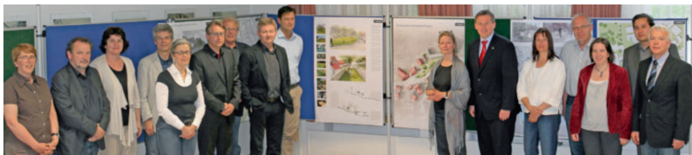
Das Preisgericht des nichtoffenen Wettbewerbs zur Umgestaltung des Schlossplatzes in Diemelstadt-Rhoden (siehe auch die Seiten 7 – 9)