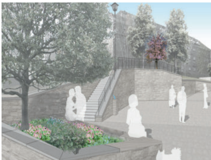
3. Preis: B.S.L. Landschaftsarchitekten, Soest