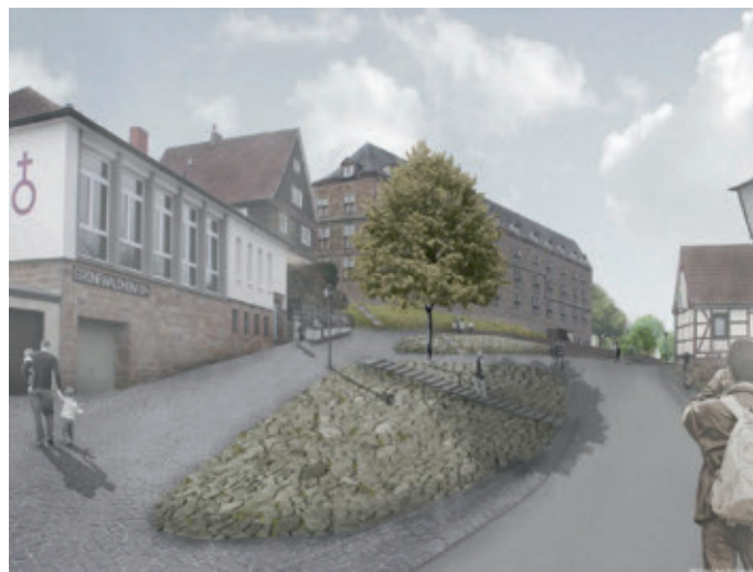
3. Preis: Mann Landschaftsarchitektur, Fulda