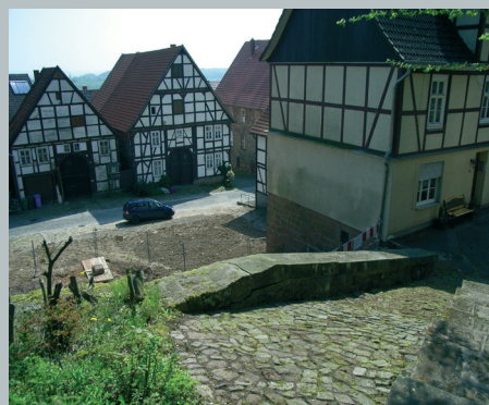
Öffentlicher Weg und Gartengrundstücke Lange Straße 21