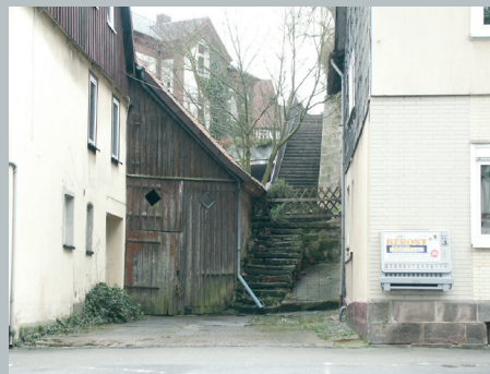
neue alte Wege zwischen Landstraße 17 und 19